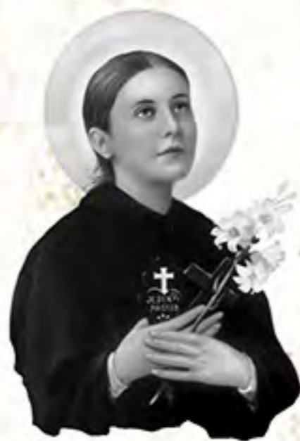
Santa Gema de Galgani