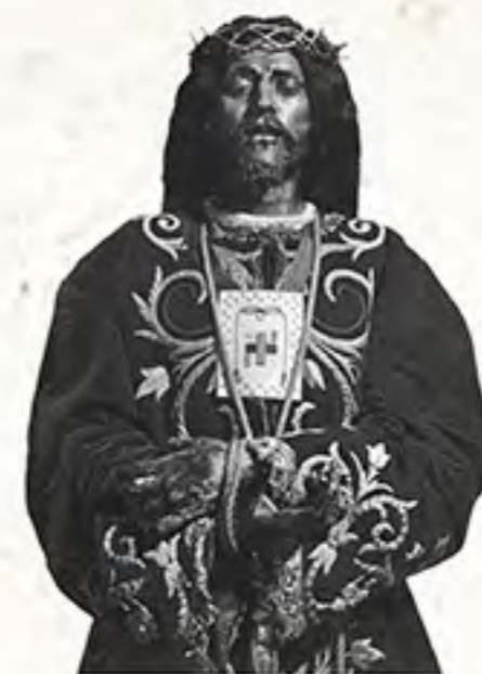
Cristo de Medinaceli