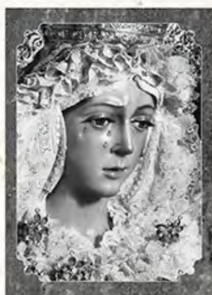
V. de la Macarena