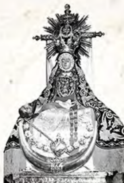
V. de las Angustias