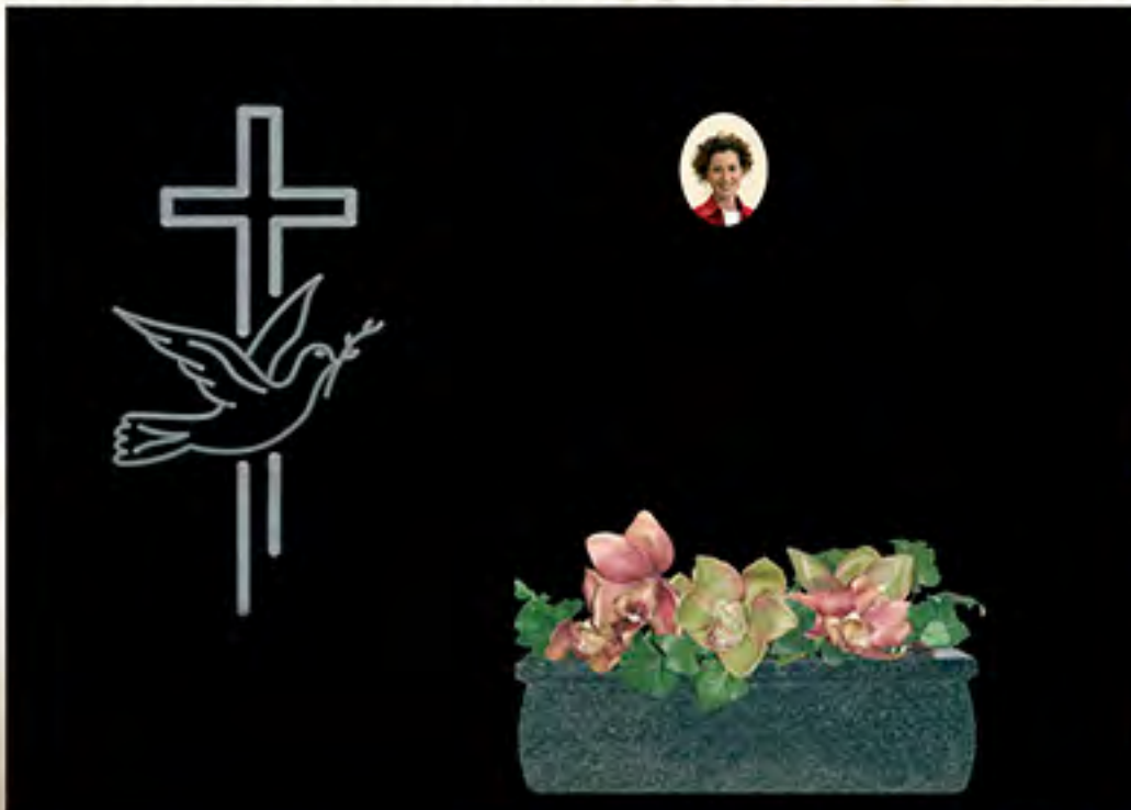
REF CF 1 Cruz plana sin pintar o pintada