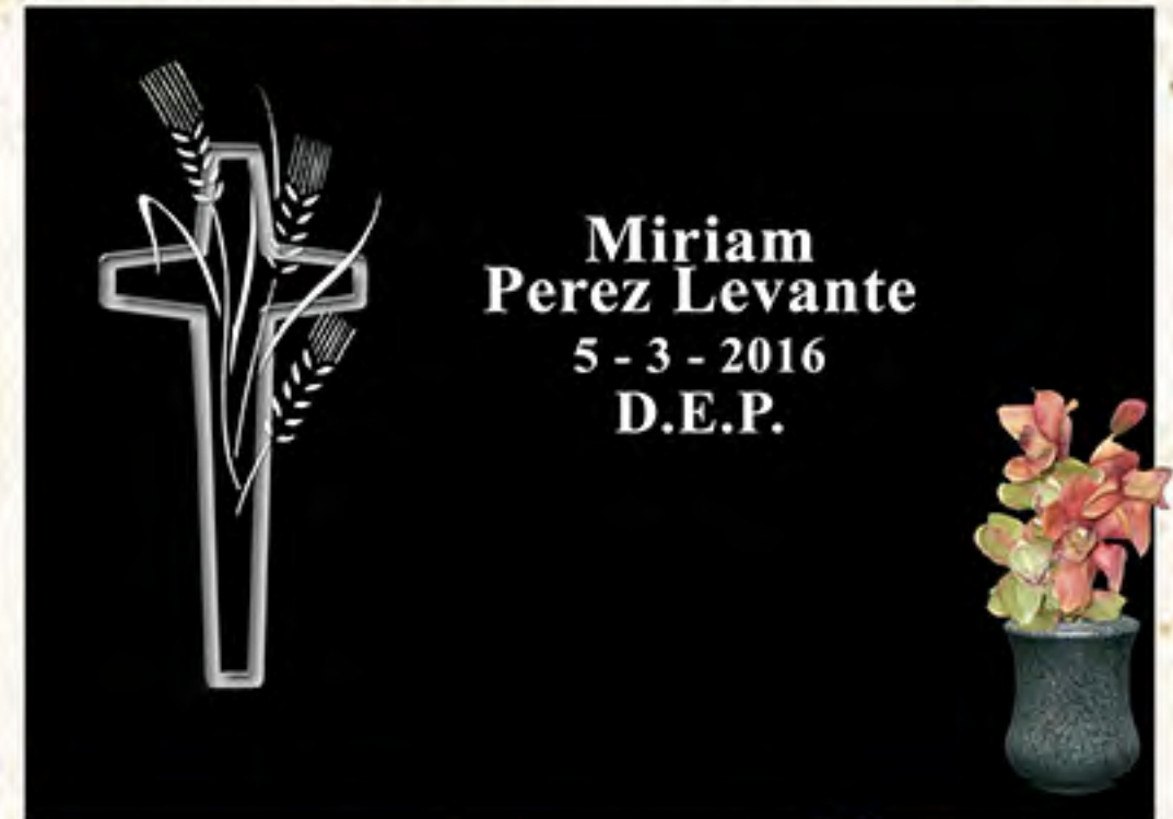
REF CML 5 Img. Láser B/N Letra Romana Minúscula