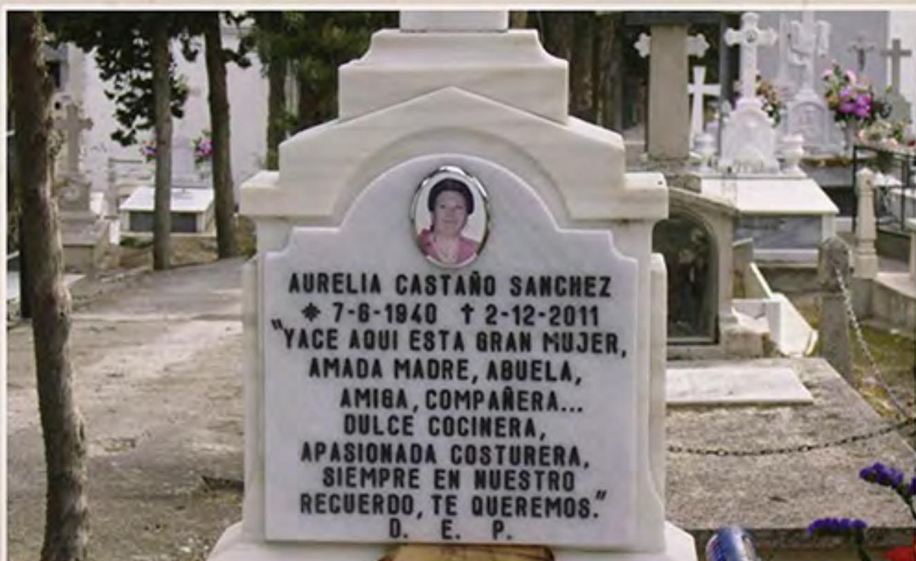
LIBRO REF. 6