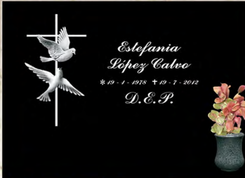
REF 104 Img. Láser B/N Letra Inglesa (solo minúscula)