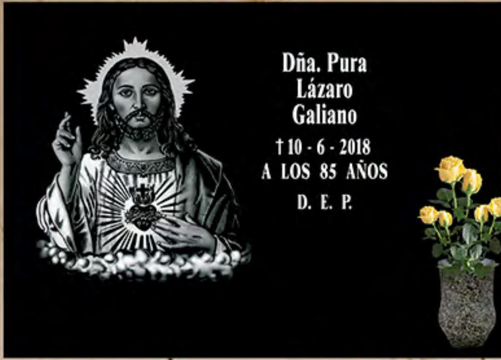
REF 05 Img. Láser B/N (Corazón de Jesús) Letra Romana Min. y May.