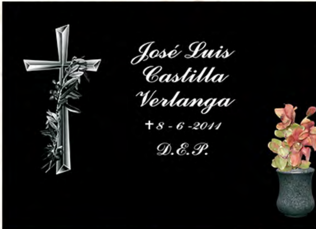
REF 113 Img. Láser B/N Letra Inglesa (sólo minúscula)