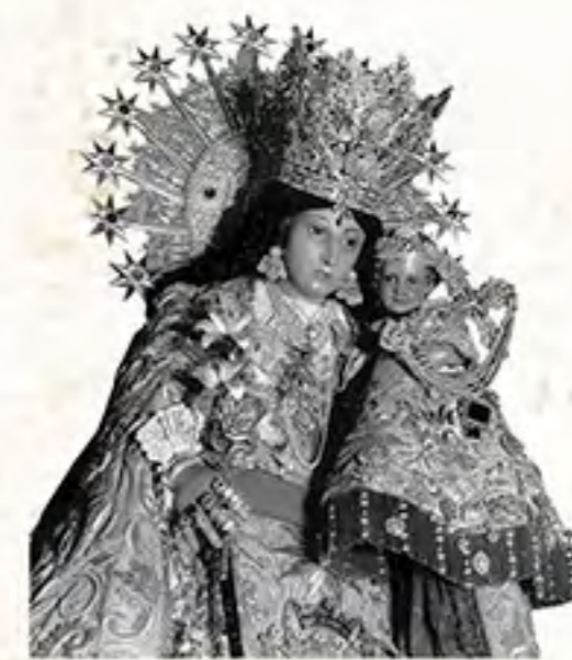
V. de los Desamparados