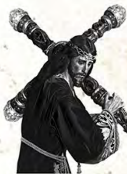
Ntro. Padre Jesús de Huerca-Overa