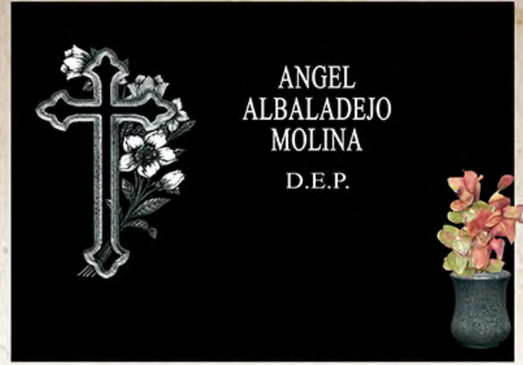
REF CML 4 Img. Láser B/N Letra Romana Mayúscula