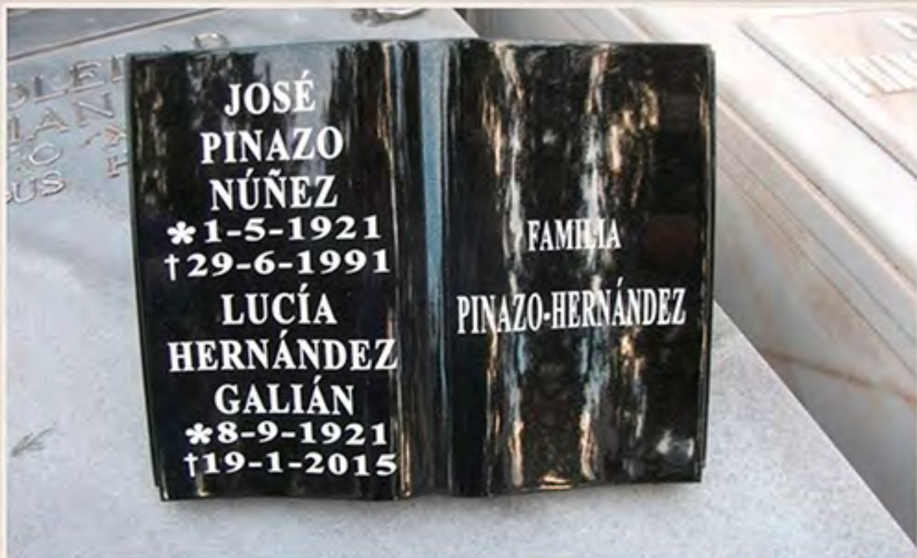
LIBRO REF. 4