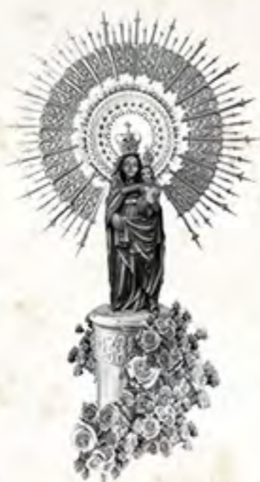
V. del Pilar