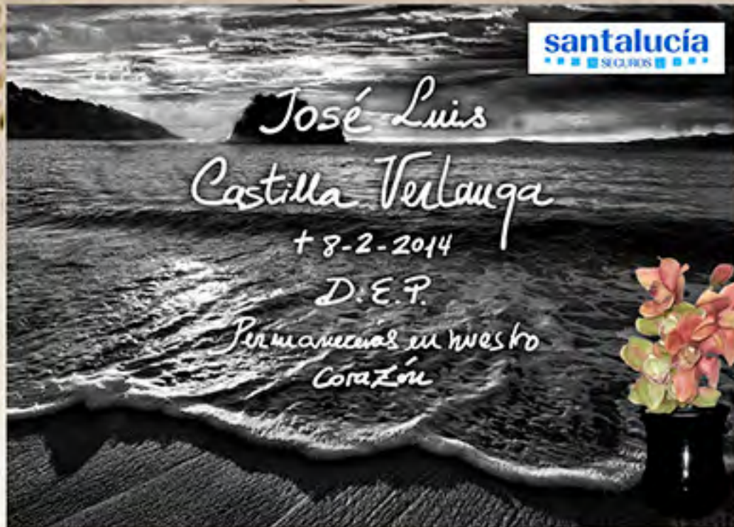
REF F6 Img. Láser B/N Letra Manuscrita min. Modelo exclusivo para