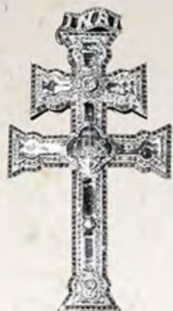
Cruz de Caravaca