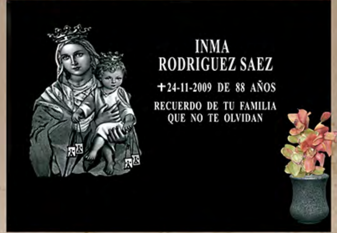
REF G 13 Img. Láser B/N Letra Romana Mayúscula